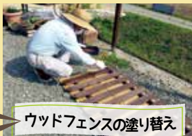
ウッドフェンスの塗り替え